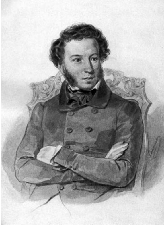
Портрет А.С. Пушкина работы Соколова.

И. ВОЛКОВА, методист детской библиотеки.